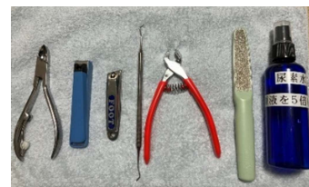
看護師のカバンに入っているフットケアグッズです